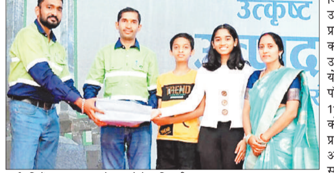
कर्मचारियों का सम्मान करते बालको के अधिकारी।