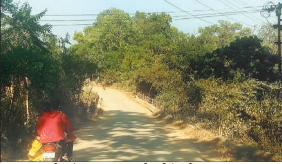
रजगामार बस्ती जाने वाला पुल जहां नहीं लगी है स्ट्रीट लाइट।