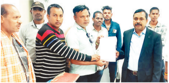
ज्ञापन सौंपते प्रभावित ग्रामीण।