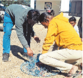
हरिभूमि न्यूज ►► कटघोरा

नागरिकों की सुरक्षा सुनिश्चित करने और पशुओं से फैलने वाले संक्रमणों की रोकथाम के उद्देश्य से जिले के सभी नगरीय निकायों में आवारा कुत्तों के लिए व्यापक एंटी-रेबीज वैक्सिनेशन अभियान शुरू कर दिया गया है। इसी कड़ी में कटघोरा नगर पालिका परिषद और पशु चिकित्सालय विभाग की संयुक्त टीम लगातार शहर के अलग-अलग क्षेत्रों में पहुंचकर अभियान को गति दे रही है। अभियान के तहत टीम ने कटघोरा नगर के विभिन्न वार्डों, प्रमुख मार्गों और बाजार क्षेत्रों में घूमकर अब तक 50 आवारा कुत्तों का सफलतापूर्वक टीकाकरण किया है। प्रतिदिन 15 से 20 कुत्तों को सुरक्षित रूप से पकड़कर