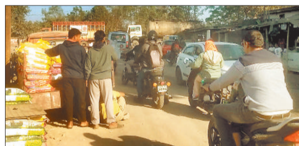
बालको रिसर्चा चौक में लगा जाम।

भारी वाहनों के आवागमन पर प्रतिबंध लगने के बाद उनका मार्ग बदल दिया गया है। इससे शहर के प्रमुख मार्गों के साथ बीच शहर में भी भारी वाहनों का जाम लगना शुरू हो गया है। बालको रिसर्ची चौक से लेकर रमगार ►►शेष पेज 3 पर