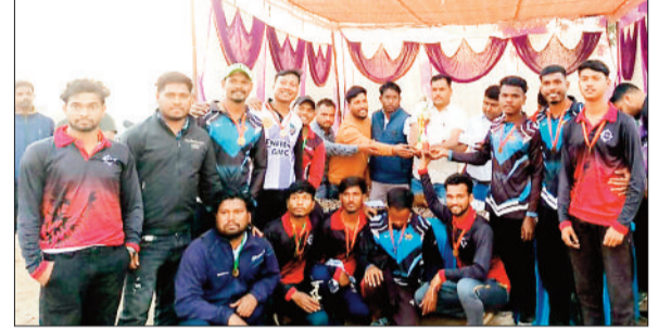
पुरस्कार ग्रहण करते विजयी टीम के खिलाड़ी।