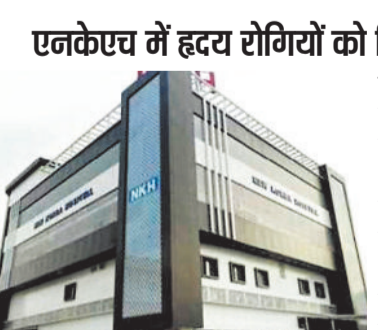
एनकेएच में हृदय रोगियों को मिल रहा बड़े शहरों जैसा उपचार