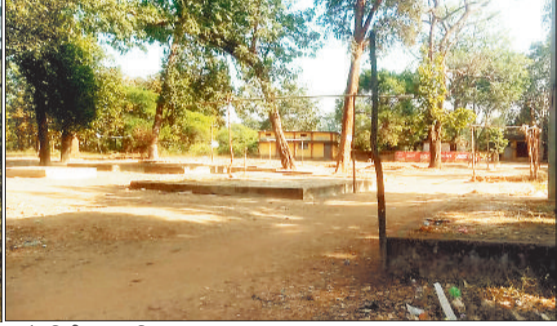
शेडविहीन सप्ताहिक बाजार स्थल।