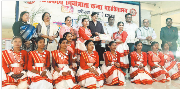
कार्यक्रम में उपस्थित महाविद्यालय की छात्र छात्राएं व अतिथि।