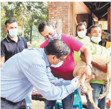
कोरबा