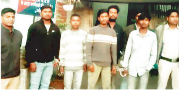
पुलिस गिरफ्तार में आरोपी।